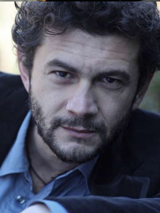
un tram che si chiama desiderio