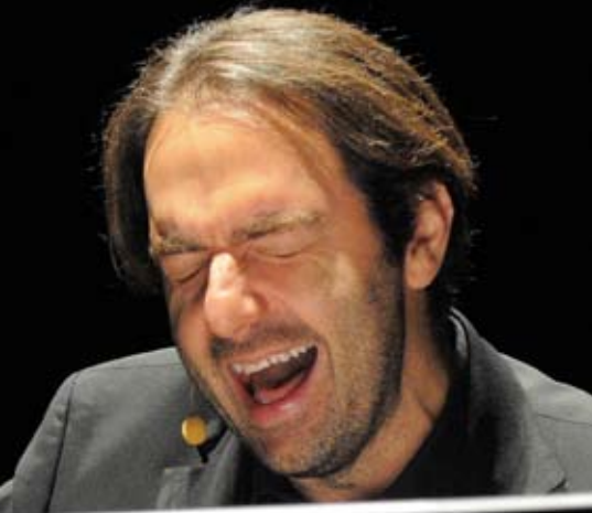
eretici e corsari