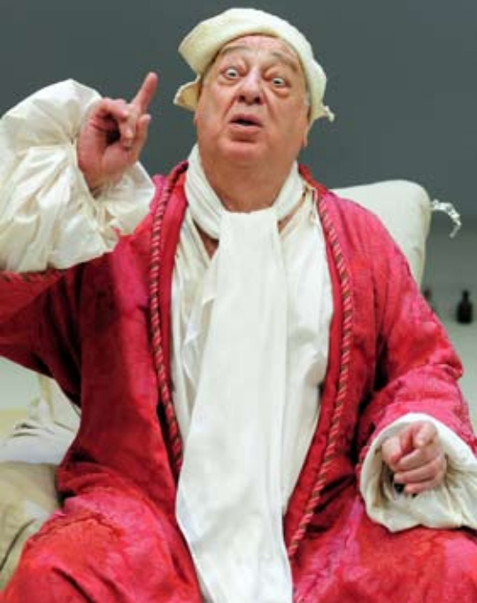
il malato immaginario