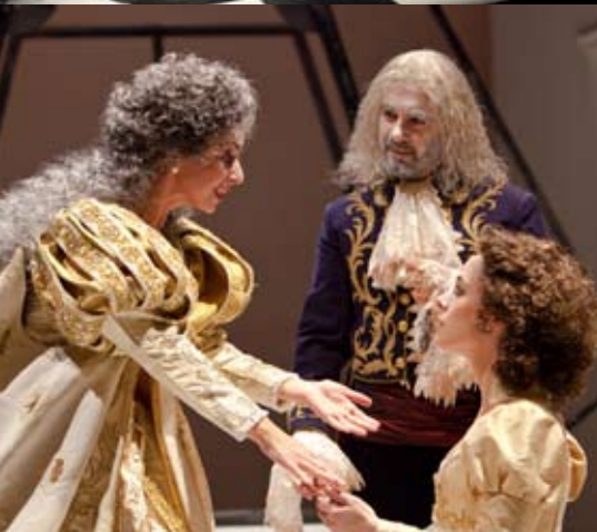
il racconto d'inverno