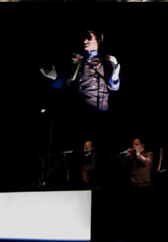
rumore di acque