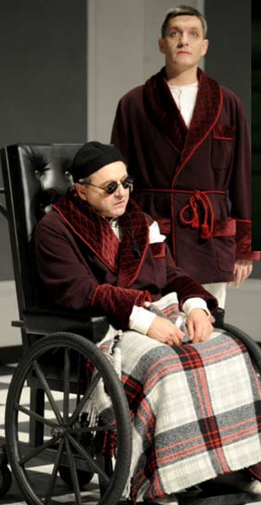
finale di partita