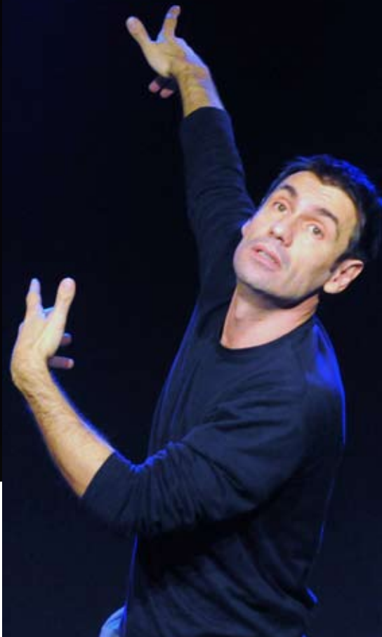
l'ingegner gadda va alla guerra

Vi vorrà una quantità grande di prove sul luogo dell'azione, vi vorrà pazienza e fatica, ma voglio veder se mi riesce di far colpo con questo metodo nuovo. Il titolo della commedia è L'Éventail ".